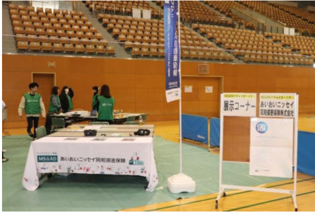
あいおいニッセイ同和損保