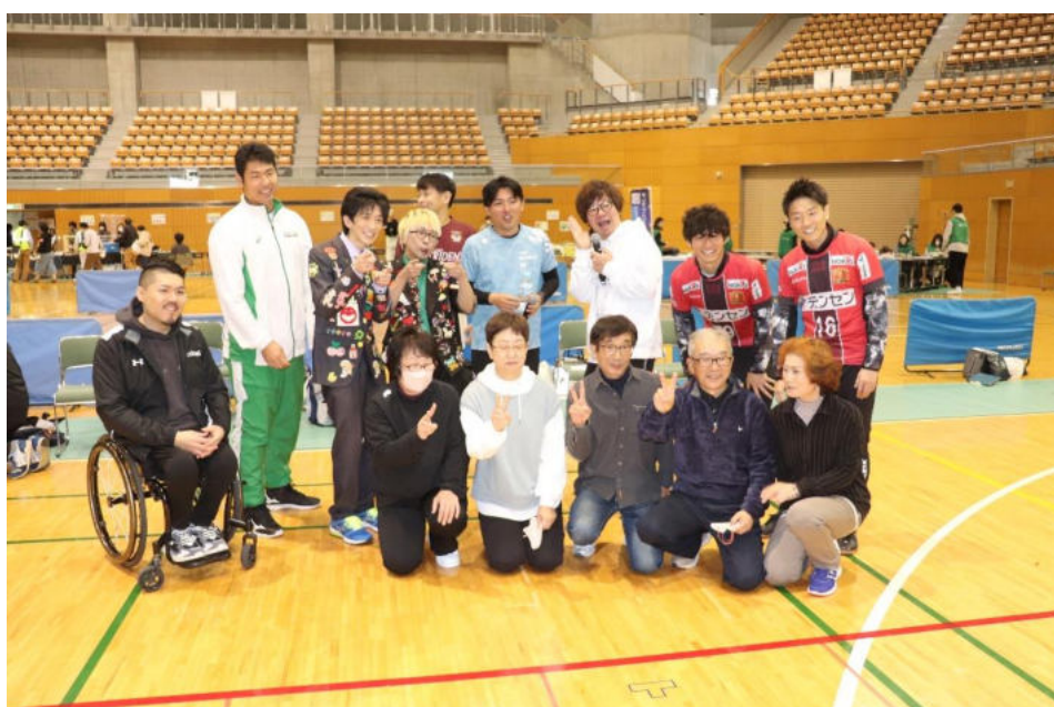
優勝チーム(柳原ボッチャの会)とゲストのみなさん