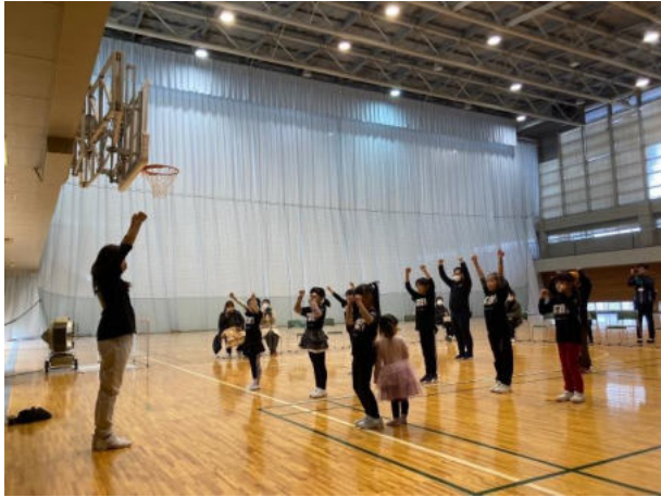
チアダンス体験会