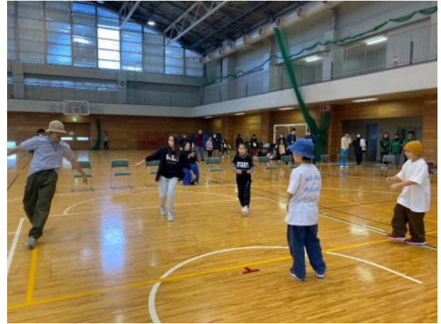
ブレイクダンス体験会