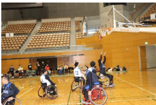
エキシビジョンゲーム3×3