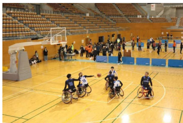
エキシビジョンゲーム3×3