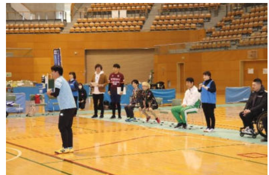
ゆでたかの(ネタ披露)