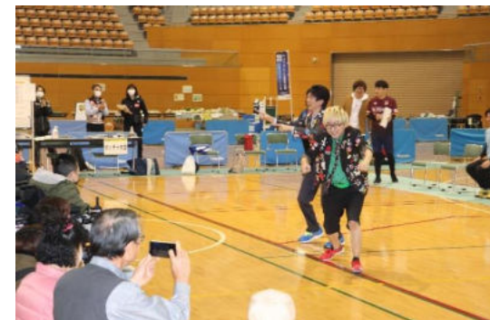
2人のトイボックス(ネタ披露)