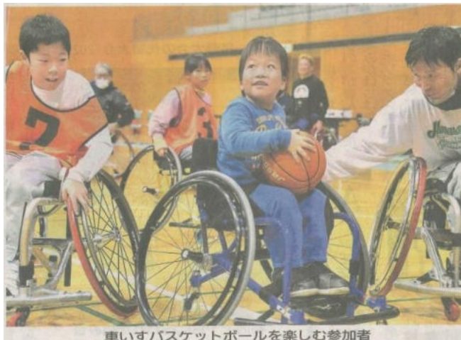
車いすバスケットボールを楽しむ参加者

長野市障害者スポーツ協会と笑顔でハイタッチ。ポッチャは23日、「NAGANOパラ」を市ホワイテで参加し、15チームで対戦。白いジャックボール(目標球)を目がけて赤と青色の球を交互に投げる姿を、家族や保護者が息をのんで見守った。