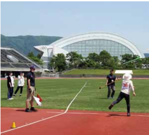
女子ジャベリックスロー