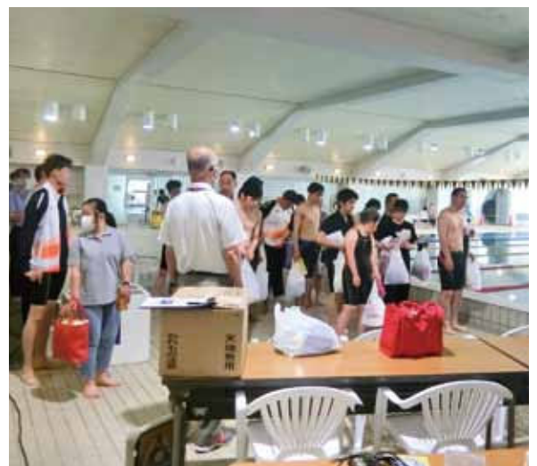
選手からお礼あいさつ（水泳競技）

長野市障害者スポーツ大会（市、障害者スポーツ協会等で行う実行委員会主催）が5月21日（日）、運動公園総合運動場において新型コロナウイルス感染症の感染拡大の影響で4年ぶりに開催されました。 陸上と水泳合わせて約100名の選手が出場し、大会新記録を出した選手が10名おり、日頃の練習の成果を思う存分発揮していました。 清泉女学院大学・短期大学、長野保健医療大学、大原学園、CSネットワーク長野の皆さんがボランティアとしてお力添えをいただき、選手との交流を深めつつ滞りなく無事に大会が終了しました。厚く御礼申し上げます。 また、9月10日（松本市、安曇野市）と17日（長野市）に長野県障がい者スポーツ大会の開催が予定されています。この県大会の記録が来年10月に佐賀県で開催される全国大会の選考記録の参考となるので、更なる記録更新を期待しています。