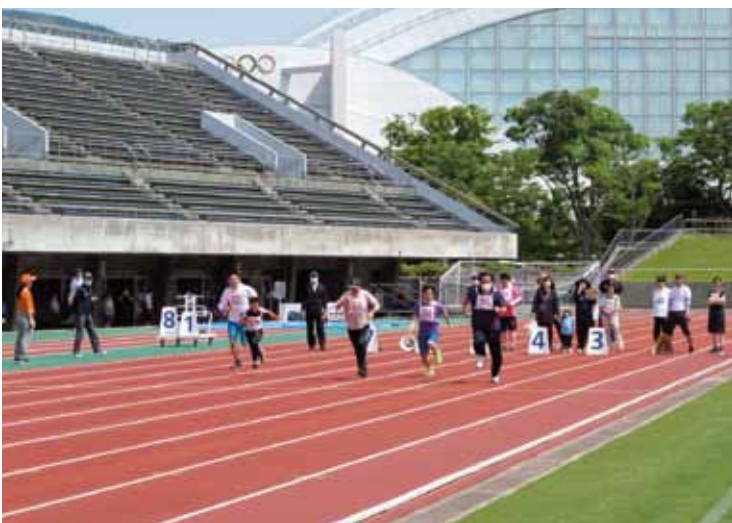
男子 50 m