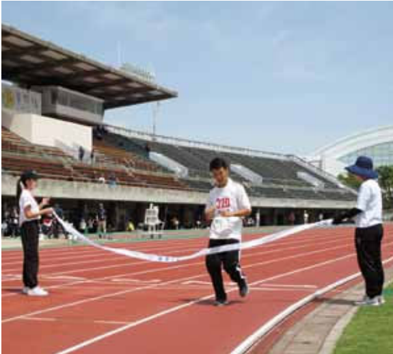
男子 1500 m