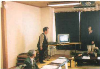
11月7日 (水)市障害者福祉センターにおいて多数の皆さんにご参加をいただき、個人会員の集いを開催しました。